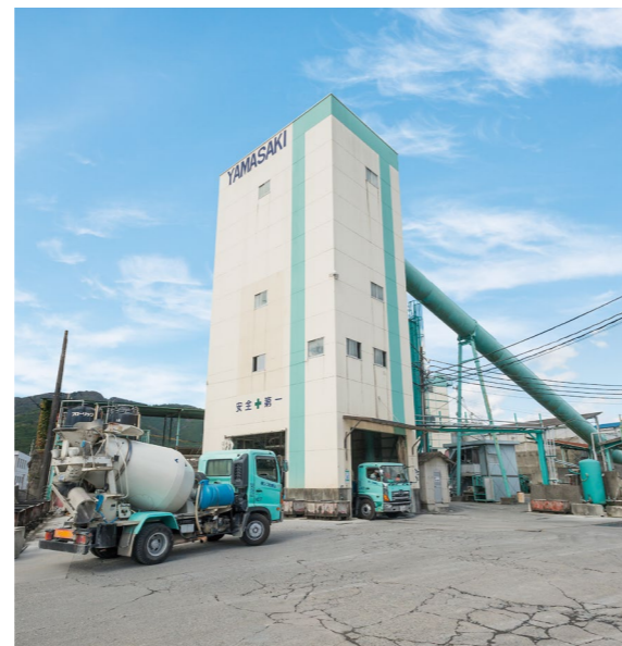
生コンクリートプラント