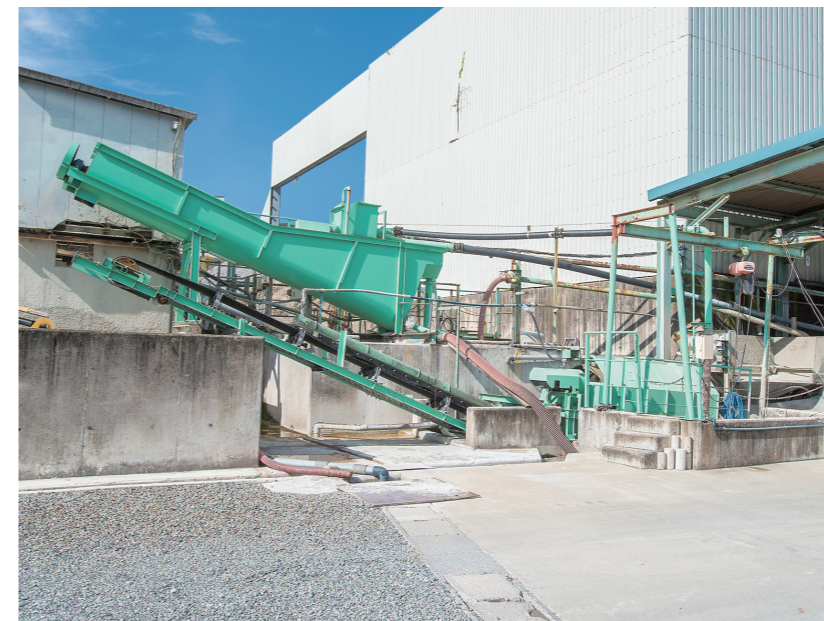
濁水処理プラント