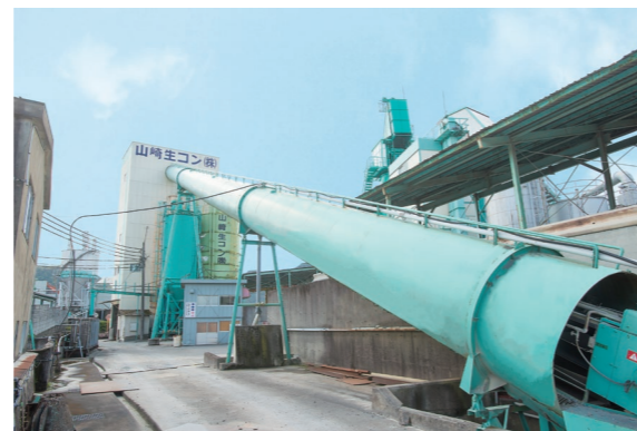
生コンクリートプラント