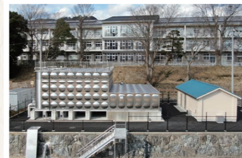
水道水源施設管内配管他整備工事

なにげなく、しかし便利に利用している建物や 駐車場、道路など、確かな当社の実績です。