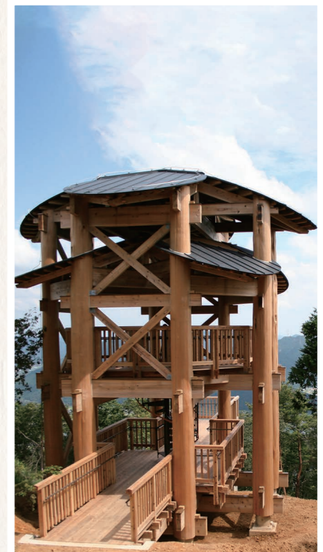
国見山展望台建築工事