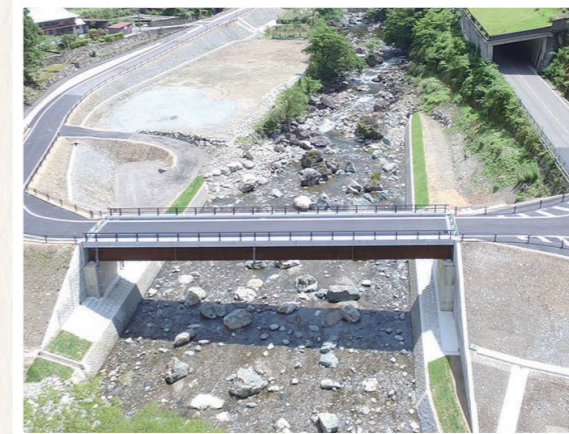
市道西二連瀬線道路改良工事