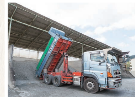
山崎建材運輸株式会社